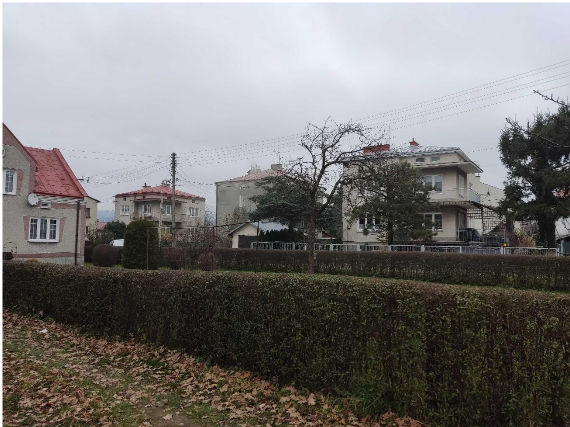
Ryc. 4 Zabudowa mieszkaniowa w granicach opracowania