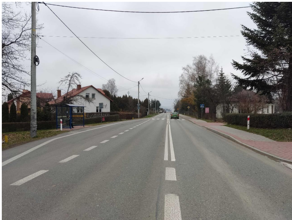
Ryc. 5 Widok na ulicę Lipińskiego