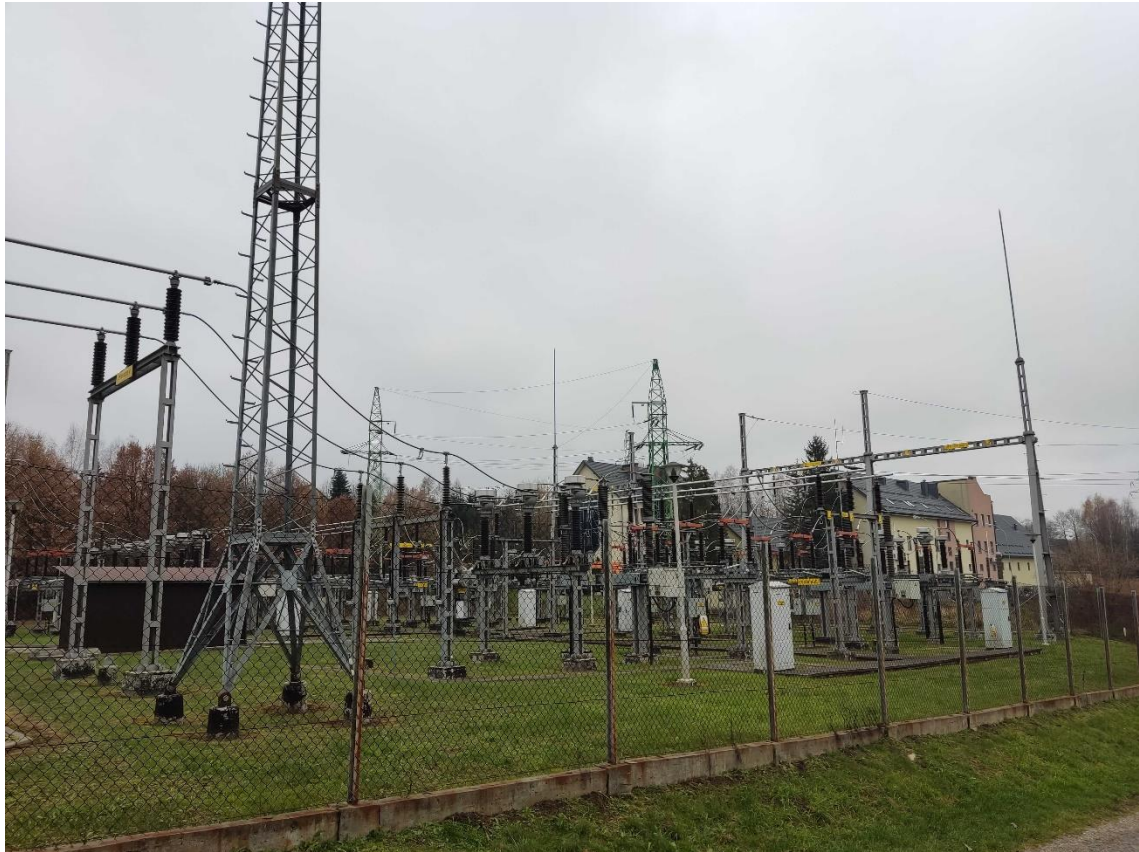
Ryc. 3 Stacja elektroenergetyczna w granicach opracowania