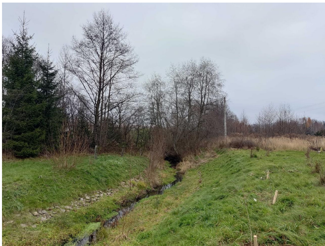
Ryc. 6 Istniejący ciek przy zachodniej granicy opracowania