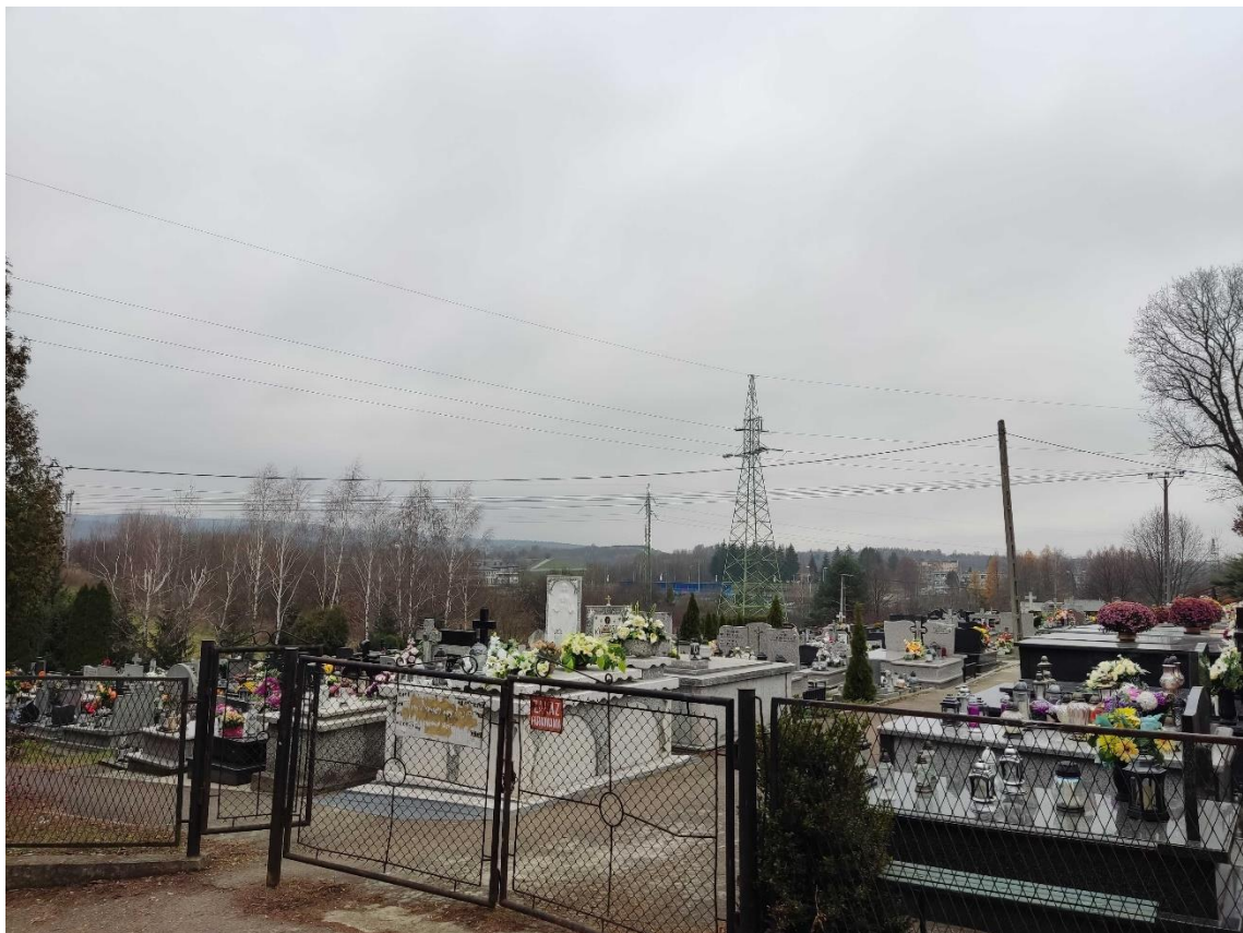
Ryc. 2 Cmentarz komunalny w granicach opracowania