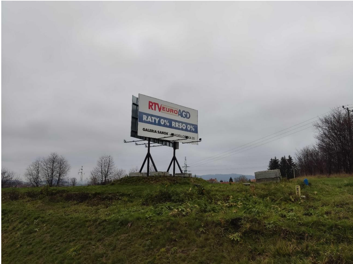
Ryc. 8 Przykład baneru reklamowego w granicach opracowania