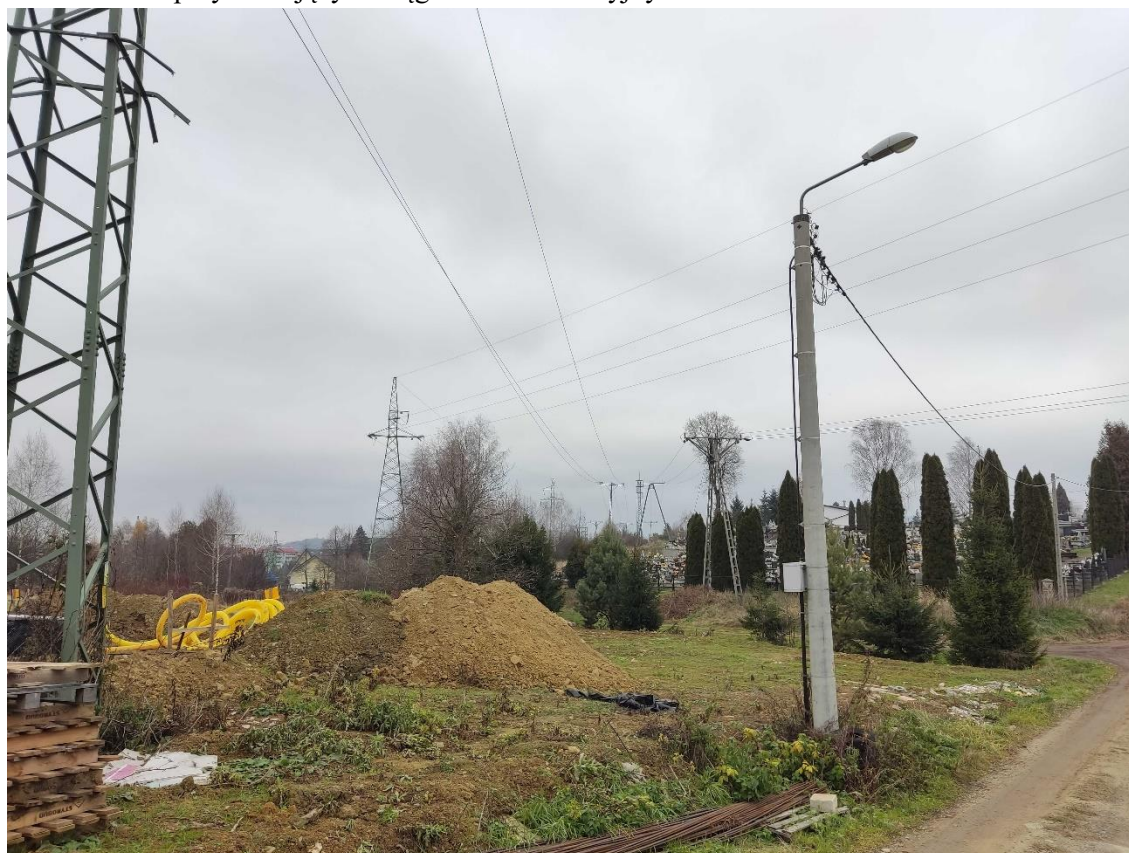
Ryc. 7 Napowietrzne linie elektroenergetyczne w granicach opracowania

Znaczna część obszaru analizy zajęta jest przez tereny zabudowane. Cały teren analizy poprzecinany jest istniejącymi ciągami komunikacyjnymi. Ich obecność wpływa negatywnie na lokalny krajobraz. Dodatkowym aspektem wpływającym negatywnie na odbiór krajobrazu terenu analizy są naziemne linie energetyczne przebiegające przez obszar opracowania. Do niekorzystnych elementów w krajobrazie można również zaliczyć banery reklamowe zlokalizowane przy istniejących ciągach komunikacyjnych.