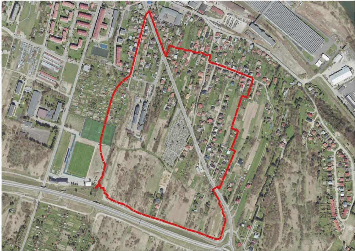
Ryc. 1 Obszar opracowania na tle ortofotomapy